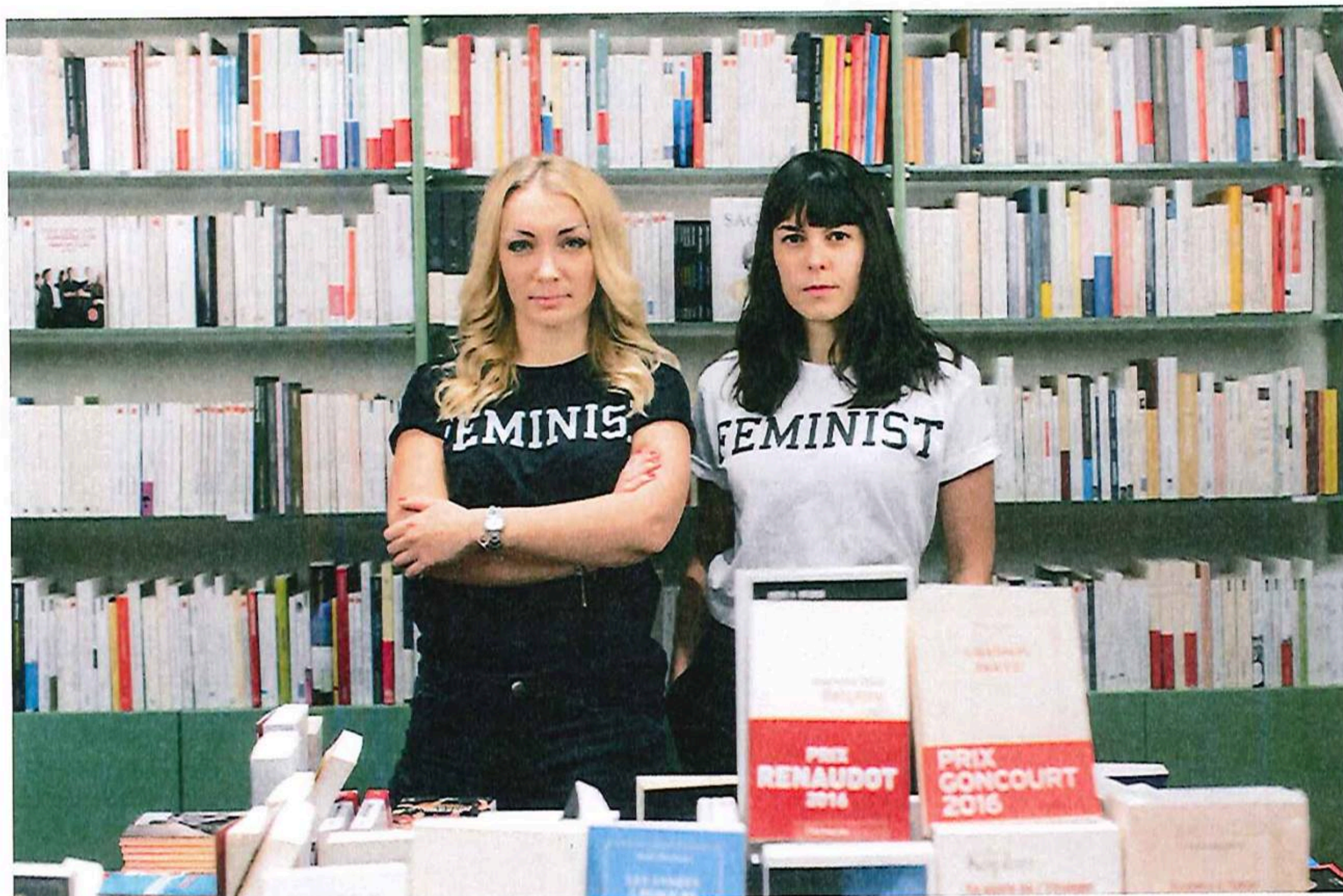
Inna Shevchenko et Pauline Hillier.